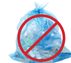
LOS RECICLABLES EMBOLSADOS