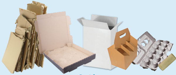
Cartón (Limpio y seco)