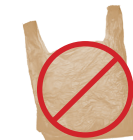
LAS BOLSAS DE PLÁSTICO

LOS ARTICULOS MENCIONADOS ABAJO NO PERTENECEN EN SU CANASTA DE RECICLAJE