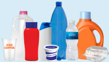
Botellas Plásticas, Jarras, Tinas y Tapas (Recipientes vacíos de cocina, lavandería, y baño)