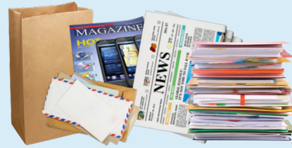
Correo Basura, Periódicos y Papel de Oficina (Bolsas de papel, sobres, y catálogos)