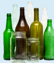
Botellas de Vidrio y Frascos (Botellas y frascos vacíos de alimentos y bebidas)