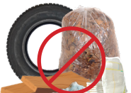
MADERA, BASURA, O NEUMÁTICOS